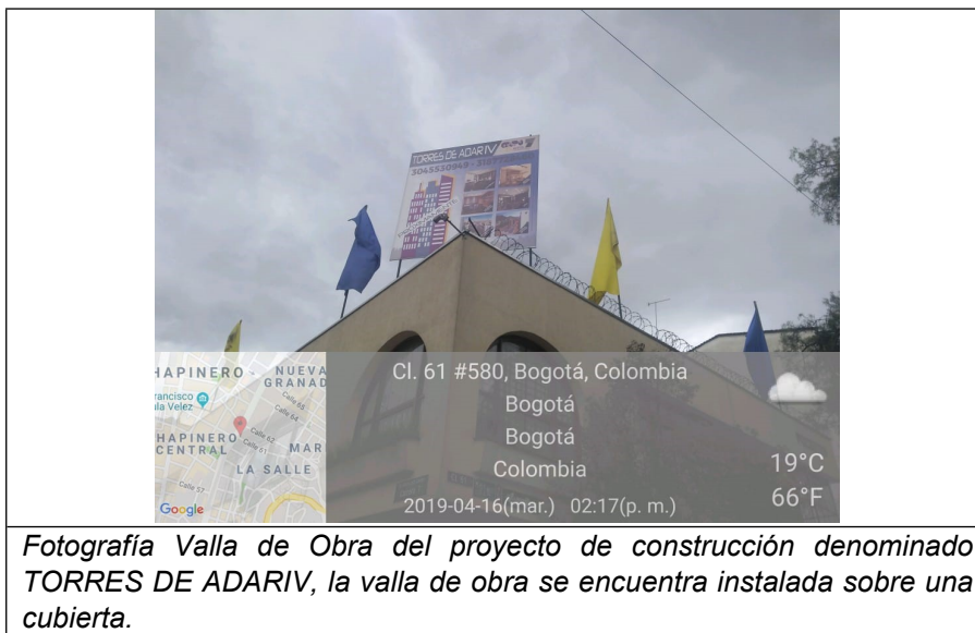
Fotografía Valla de Obra del proyecto de construcción denominado TORRES DE ADARIV, la valla de obra se encuentra instalada sobre una cubierta.