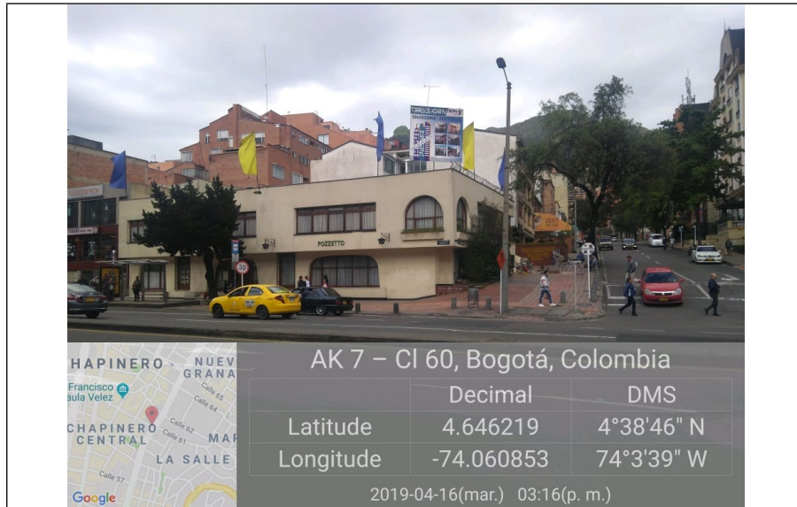
Fotografía panorámica proyecto de construcción denominado TORRES DE ADARIV, Vista por la Carrera

ALCALDÍA MAYOR DE BOGOTÁ D.C. SECRETARÍA DE AMBIENTE